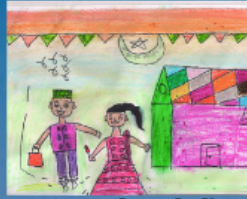
चित्र: पलक, खान वस्ती स्टडी सेंटर