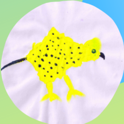
लमाण वस्ती स्टडी सेंटर